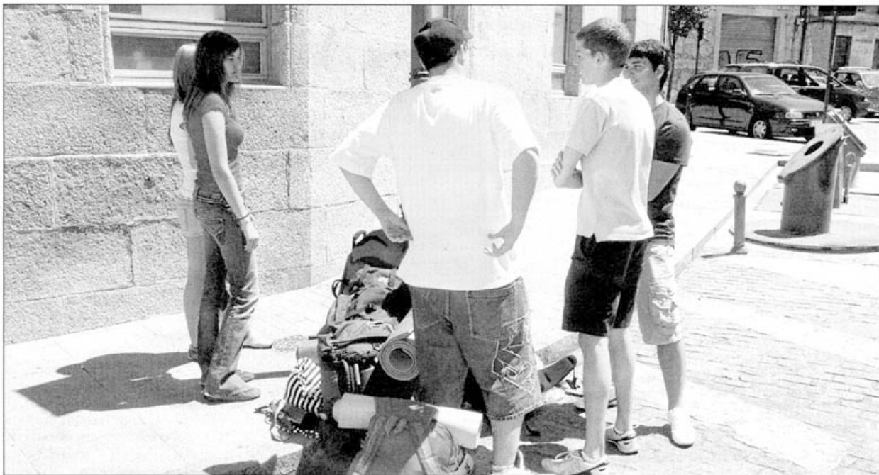
Un grupo de peregrinos en la ciudad, antes de comenzar su recorrido.